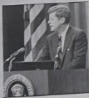
ジョン・F・ケネディ大統領