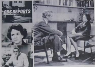
ロバート・ホワイト・スチーブンス博士